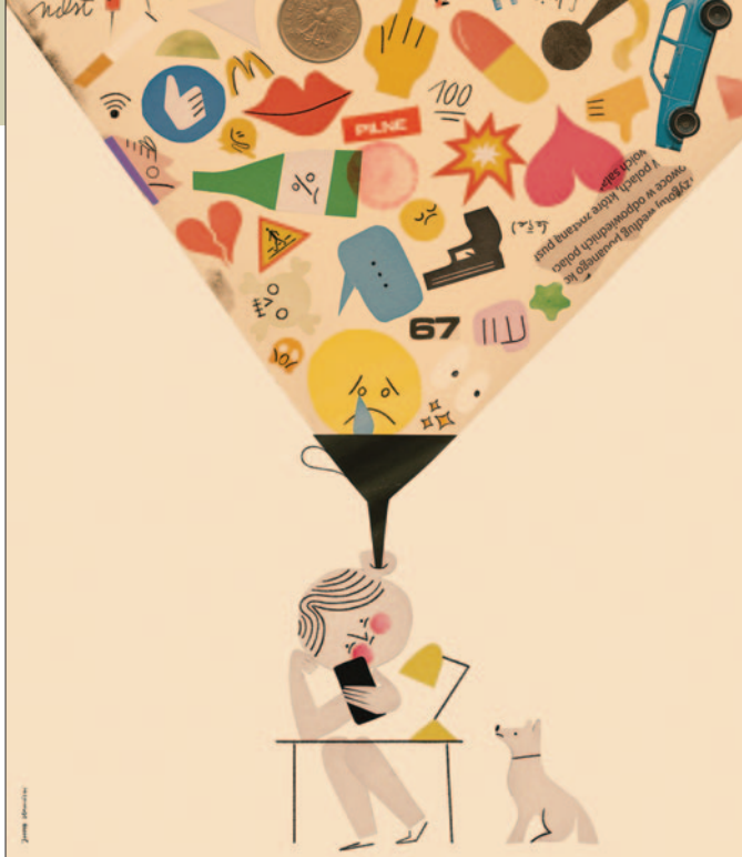
Problemy z Koncentracją , grafika Jakuba Kaminskiego