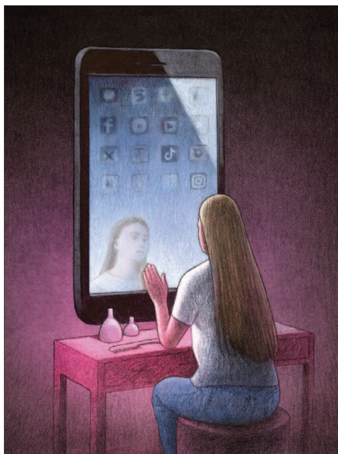
Presja Wyglądu , grafika Pawła Kuczyńskiego

W efekcie dzieci i młodzi nastolatkowie nie muszą aktywnie szukać pornografii. Często trafiają na nią przypadkowo – w środowiskach, które są dla nich podstawowym kanałem komunikacji, rozrywki i kontaktu z rówieśnikami.