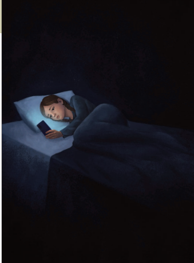
Zaburzenia snu , grafika Pauli Dudek