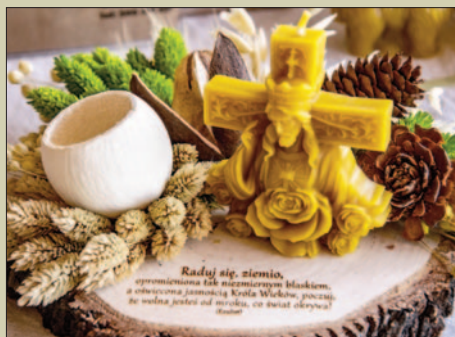
V Zagórzeński Jarmark Wielkanocny – odczarowany! STR. 30