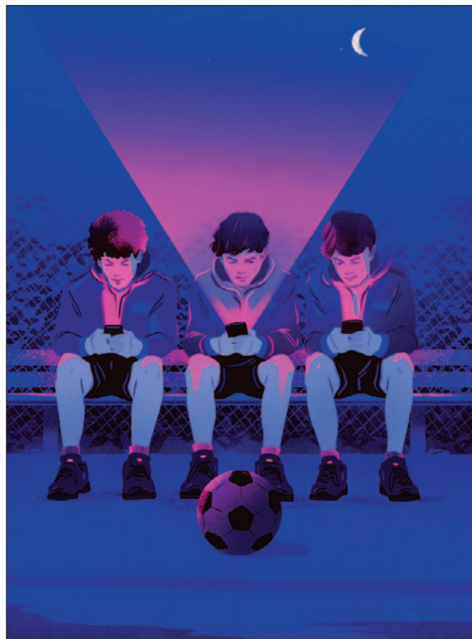
Uzależnienie , grafika Magdaleny Pankiewicz

Dla dzieci i nastolatków granica między treścią autentyczną a reklamową jest często nieczytelna. Reklama bywa ukryta w codziennych relacjach, filmach i „zwykłym życiu”