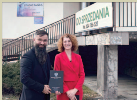
GS-y kupione. Nowy rozdział dla centrum Mszany Dolnej STR. 2