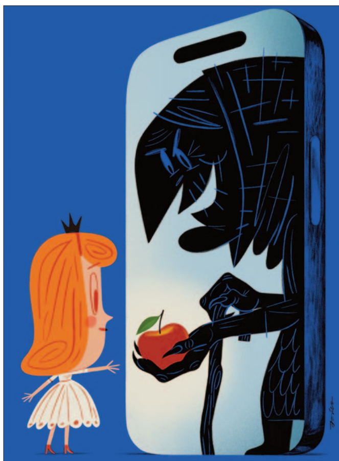
Ryzykowne zachowania , grafika Pawła Jońca

Mowa nienawiści i wrogie formy komunikacji nie są zjawiskiem nowym. W przeszłości miały jednak ograniczony za-