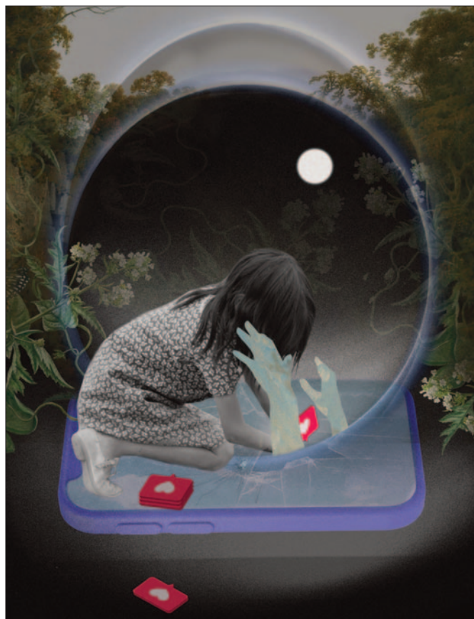
Depresja i Lęk , grafika Jagody Stączek

Sen jest jednym z podstawowych filarów rozwoju dzieci i nastolatków. Odpowiada m.in. za regulację emocji, procesy uczenia się i zapamiętywania, regenerację fizyczną, równowagę psychiczną.