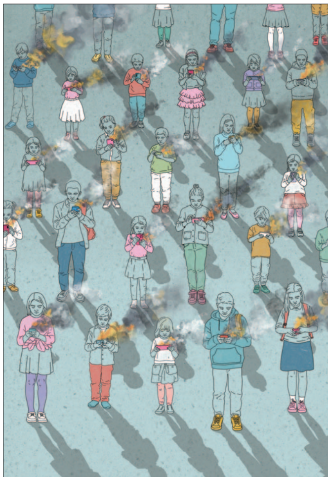
Przemocowe treści , grafika Kamili Szcześniak