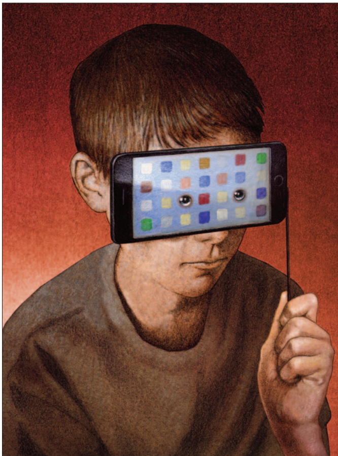
Wystawa 15 POWODÓW , grafika Pawła Kuczyńskiego

U dzieci i młodszych nastolatków coraz częściej obserwuje się niedobór snu oraz obniżoną jego jakość. Zjawisko to wiąże się z funkcjonowaniem w środowisku cyfrowym, w którym granice między dniem a nocą ulegają zatarciu, a dostęp do bodźców i komunikacji jest stały. Zaburzenia snu obejmują m. in.: